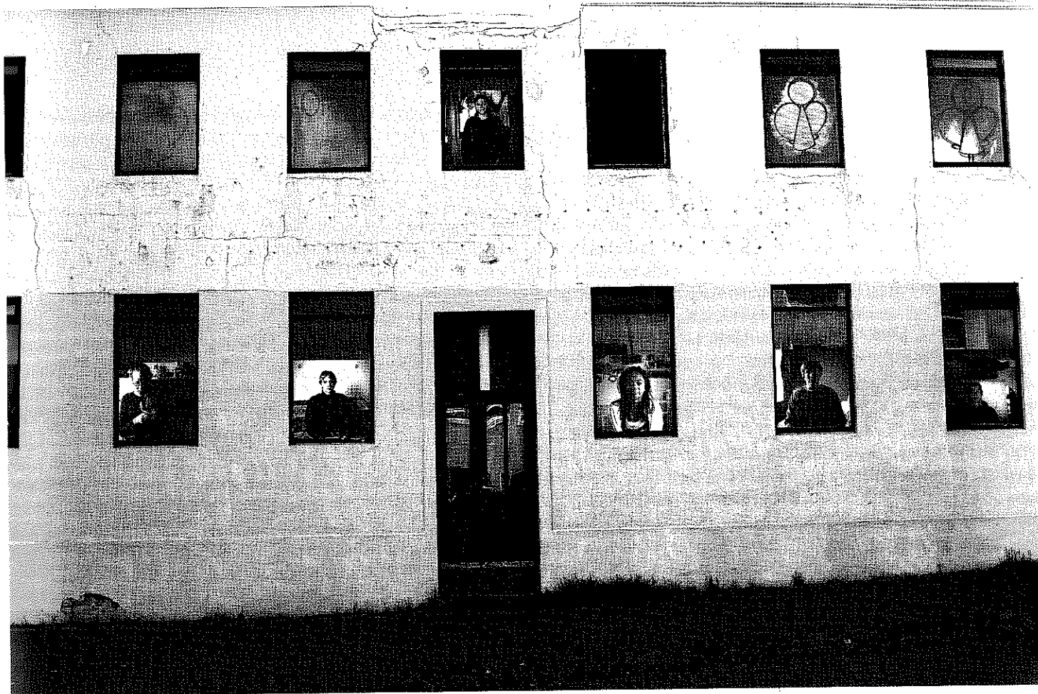
leva Epnere. Fotografijas no sērijas "Es gribētu būt" / Photos from the series I would like to be . 2006