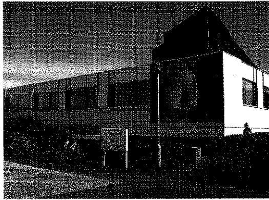
(1) Sindijas Šermenas izstādes atklāšana Íslandes Nacionālajā galerijā / The opening of the exhibition by Cindy Sherman at the National Gallery of Iceland