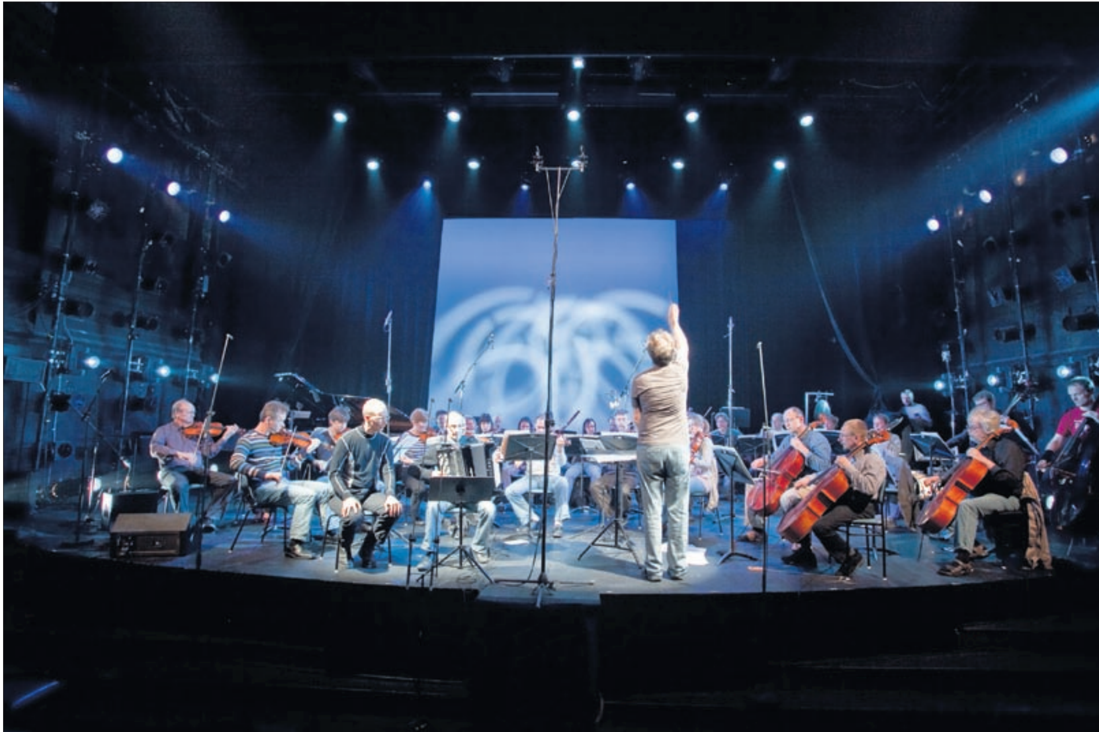
Vaasan kaupungin-orkesteri esiintyi eilen illalla Islannin oopperan lavalla yhdessä kymmenen islantilaismuusikon kanssa osana Reykjavik Art Festivalia. Ohjelmassa oli sekä suomalaisromanttista musiikkia ja islantilaisista modernia musiikkia.

Taloudellisen nousun vuosina festivaalilla vieraili supertähtiä, kuten Elton John ja Eric Clapton. Nyt budjetti on laihempi, mutta festivaaliohjelma on pidetty hyvin tasokkaana.