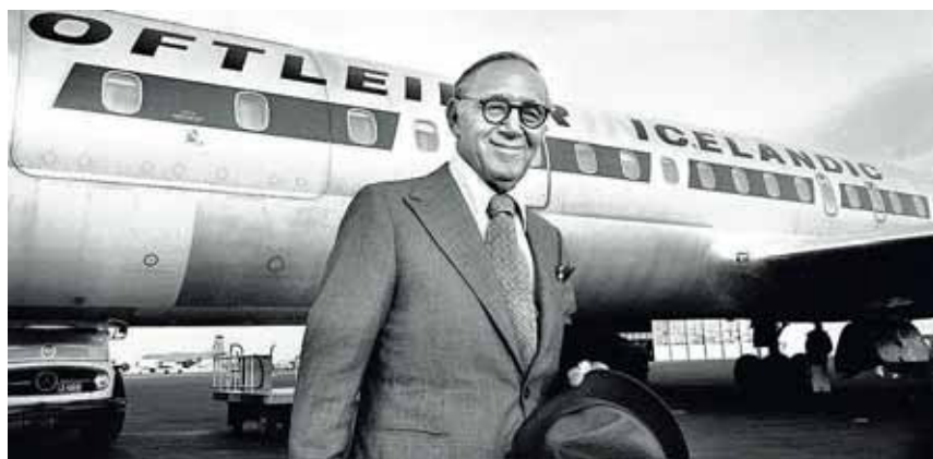
Djassmeisterinn Benny Goodman var hress við komuna til landsins sumarið 1976.

„Litlu hjónin“ André Previn og Mia Farrow á Keflavíkurflugvelli 1972. Þau voru elskuleg.