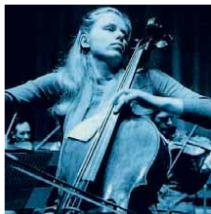
Jacqueline du Pré var undrabarn í sellóleik.

Myndin fræga af Herbie Hancock á Austurvelli.