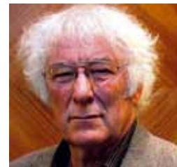
Nóbelskaldinn Seamus Heaney kom árið 2004.

Í samtalinu upplýsti Heaney að hann notaði ekki tölvupóst. „Ég hef enga þörf fyrir að heyra frá fólki sem vill ná tali af mér. Mér skilst að með tölvupóstfang sé maður varnarlau. Fólk geti dælt inn skilaboðum. Ég hef engan áhuga á því að fá boð um að fara neitt, ég vil ekki beiðnir um viðtöl, ég vil ekki fyrirspurnir frá nemendum. Í hvert skipti sem ég svara ekki, þá er ég sekur. Aðferðir nitjándu aldar myndu alveg duga mér.“