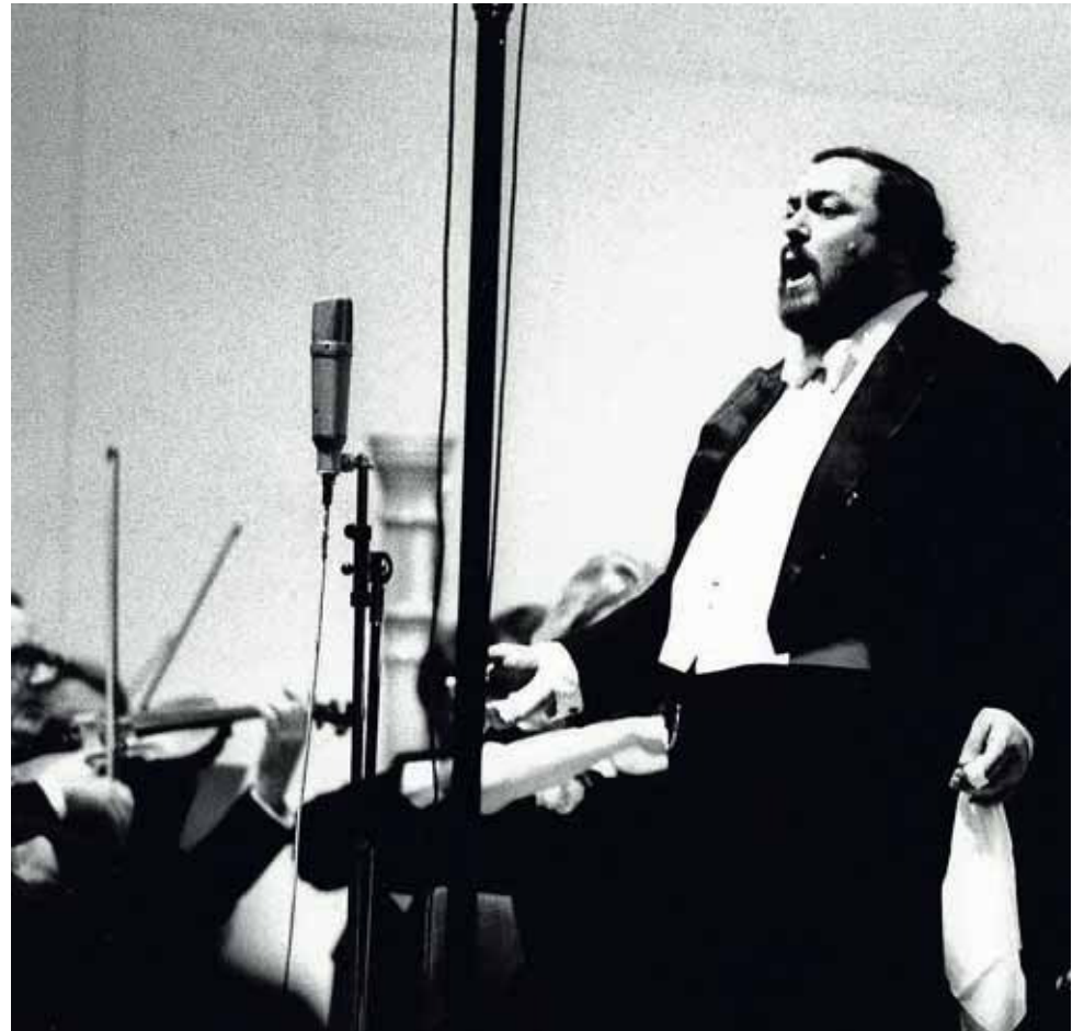
Tenórsöngvarinn Luciano heitinn Pavarotti þenur raddböndin á tónleikum á Listahátíð í Reykjavík 1980.