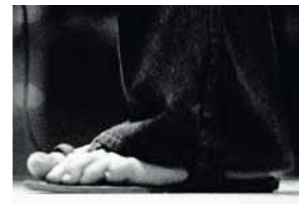
Tænar á Robert Plant vöktu sérstaka athygli en þessi mynd birtist með umsögn um tónleika Led Zeppelin í Morgunblaðinu.