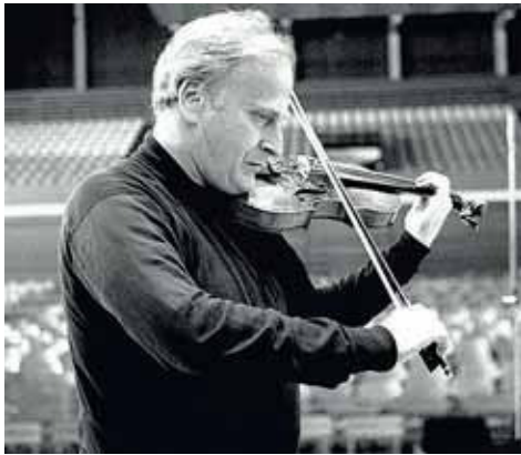
Yehudi Menuhin, eitt mesta séni tónlistarsögunnar, á æfingu í Laugardalshöllinni 1972.