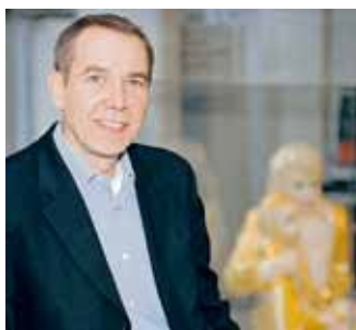
Jeff Koons sumarið 2004. Í bakgrunni eru Jackson og Bubbles.

Einn af forsprökum hugmyndalistarinnar, Lawrence Weiner, kom á Listahátíð 2000 og notaði tækifærið til að færa Háskólanum á Akureyri verk að gjöf. Við þá athöfn kom fram að yfirlýst stefna Weiners væri að færa listina út til hins almenna