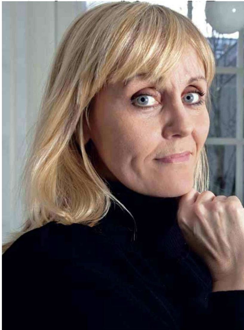
„Íslendingar líta upp til hópa á menningu og listir sem sjálfsagðan hluta af sínu daglega lífi,“ segir